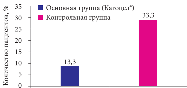
Рис. 3. Частота повторного выявления вируса по окончании терапии

Пациенты были разделены на две группы – основную и контрольную. Пациенты основной группы (n = 30) дополнительно к симптоматической терапии получали Кагоцел® по схеме лечения ОРВИ соответственно возрасту ребенка в течение четырех дней. Эффективность препарата Кагоцел® оценивали по результатам динамики основных клинических симптомов заболева-